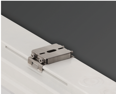
Wand- oder Deckenmontage Hängende Montage